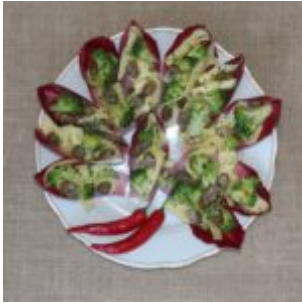
Łódeczki z brokołem i serem.