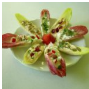
ŁÓDECZKI Z SUROWEJ CYKORII