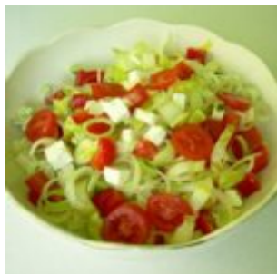
SAŁATKA Z CYKORII Z FETA