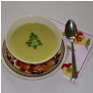
Zupa krem z cykorii.