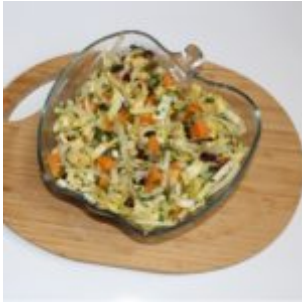
Słodka sałatka z cykorii i mandarynek.