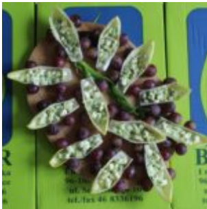
Cykoriowe bolidy F1