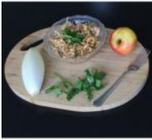
SURÓWKA Z CYKORII Z JABŁKIEM I KETCHUPEM