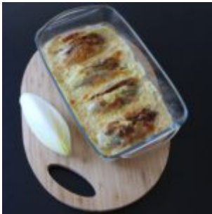
ZAPIEKANKA Z SZYNKA po belgijsku