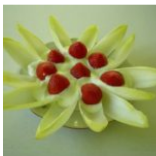
CYKORIA Z JOGURTEM I TRUSKAWKAMI