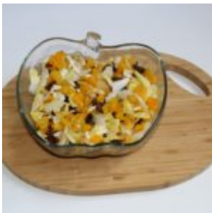
Sałatka z cykorii z brzoskwinia i migdałami