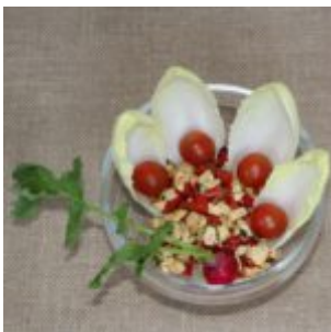
Sałatka z cykorii i kurczaka