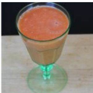
Letni koktajl z cykorii