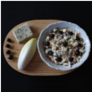
Sałatka z niebieskim serem