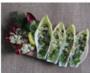
Cykoriowe łódeczki z tuńczykiem i ryżem.